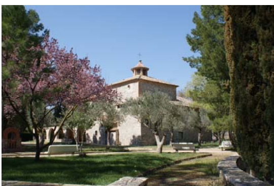
Ermita Ntra. Sra. la Virgen de Dos Aguas