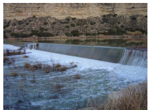
Azud de Pla d'embataler